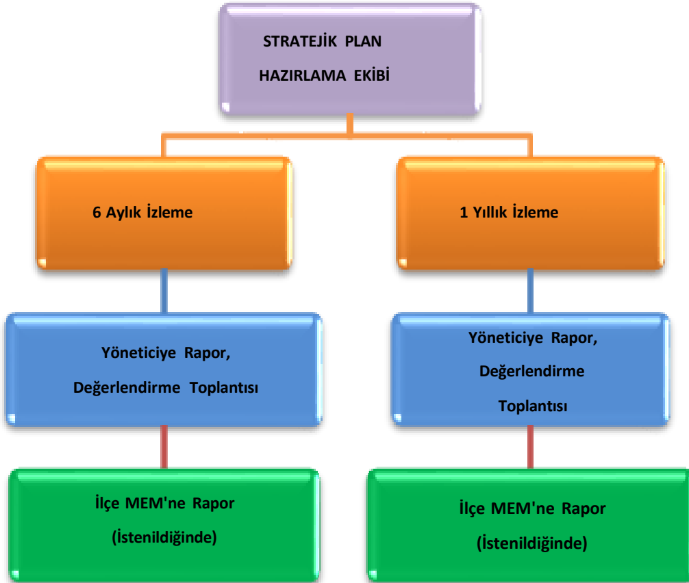
Tablo 36: İzleme ve Değerlendirme Tablosu

Müdürlüğümüzün 2024-2028 Stratejik Planı İzleme ve Değerlendirme sürecini ifade eden İzleme ve Değerlendirme Modeli hazırlanmıştır. Müdürlüğümüzün Stratejik Plan İzleme- Değerlendirme çalışmaları eğitim-öğretim yılı çalışma takvimi de dikkate alınarak 6 aylık ve 1 yıllık sürelerde gerçekleştirilecektir. 6 aylık sürelerde rapor hazırlanacak ve değerlendirme toplantısı düzenlenecektir. İzleme-değerlendirme raporu, istenildiğinde İlçe Milli Eğitim Müdürlüğü'ne gönderilecektir. Ayrıca ilçemizin Mülki İdari Amirine sunulacaktır. 1 yıllık izleme-değerlendirme çalışmaları, Stratejik Planımızda yer alan hedeflerin yıllık düzeyde ifade edildiği Performans Programı ve yılsonunda gerçekleşme düzeylerinin belirlendiği Faaliyet Raporu hazırlanarak yapılacaktır.